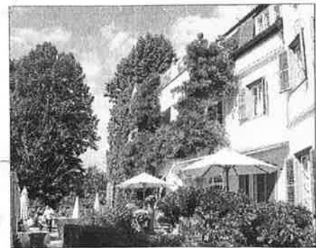
Frühstück und abendlicher Drink mit Blick auf den Wörthersee vom grünen Schloß aus.