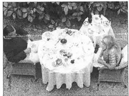
Nirgends auf der Welt wird das Frühstück so zelebriert wie in dem kleinen Strandhotel.